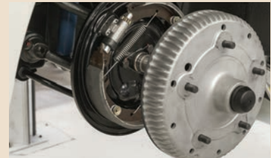
Montage der Bremstrommel