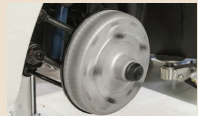
Rotierende Bremstrommel - Simulation des Fahrzeugzustandes