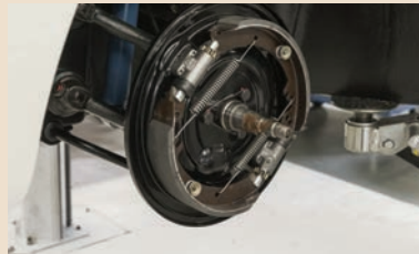
Am Fahrzeug montierte Bremsbacken